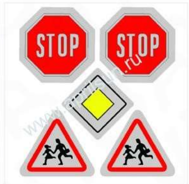
Набор наклеек "Знаки" 5 элементов 4*4 см*5 шт