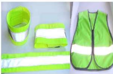
Светоотражающие повязки, значки и жилеты