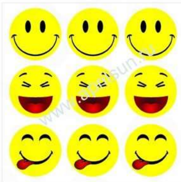
Набор наклеек "Улыбка" 9 элементов 3*3 см*9 шт