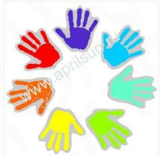
Набор наклеек "Ладочки" 6 элементов 3*3 см*6 шт