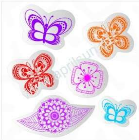
Набор наклеек "Бабочка" 6 элементов в наборе Размеры: 3*3см*3 шт и 2*2 см* 1 шт 6*4см*1 шт